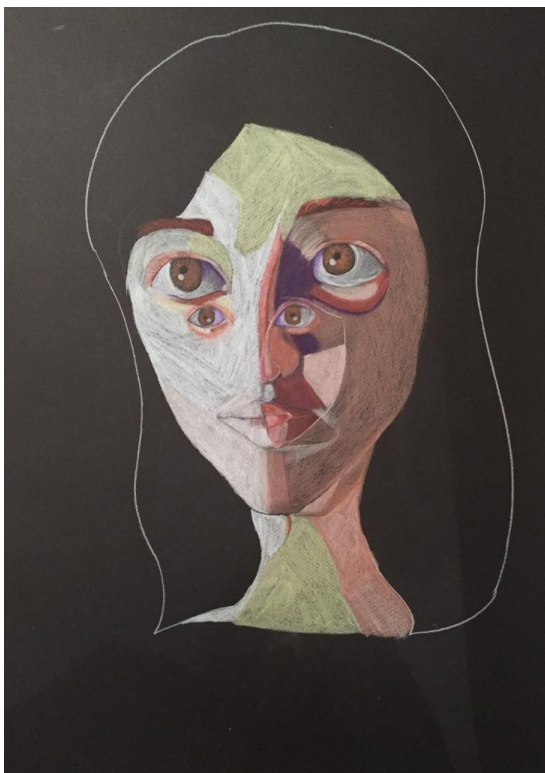
εικ. 6 έργο ζωγραφικής της Μαργαρίτας Καραναστάση

Μια άλλη πηγή έμπνευσης για κατασκευή μάσκας μπορεί να είναι εικόνες ή πίνακες ζωγραφικής όπως ο παρακάτω πίνακας στην εικόνα 6